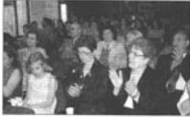
Geceye çok sayıda İstanbul hayranı Türk ve Alman katıldı.