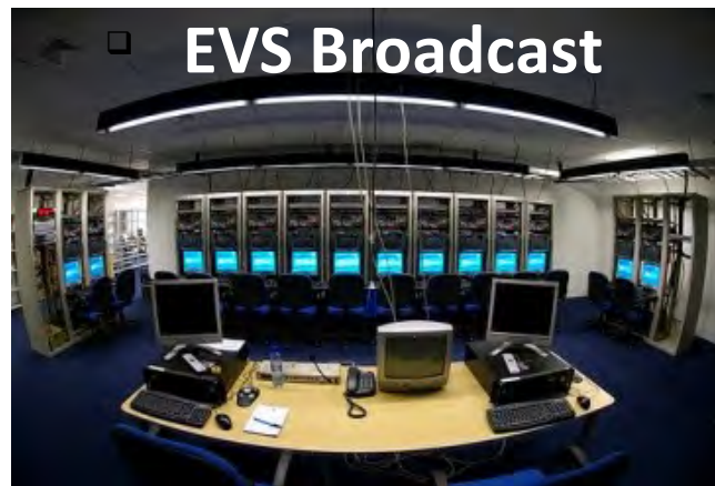
□ EVS Broadcast