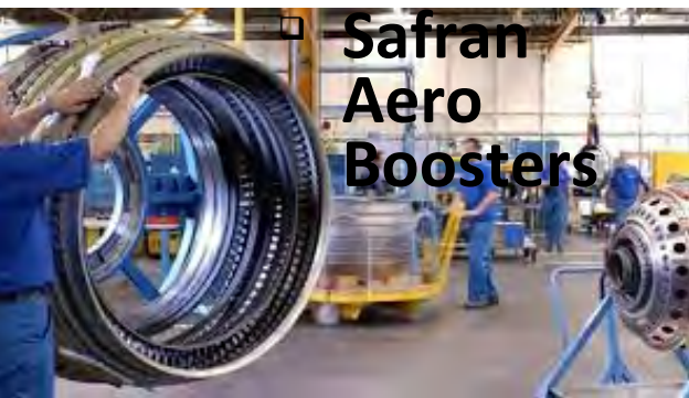
□ Safran Aero Boosters