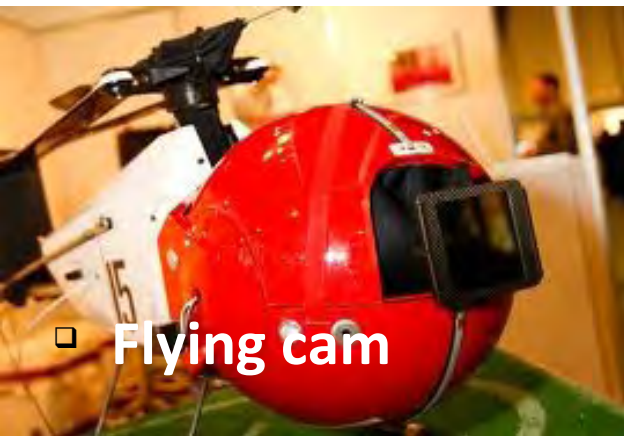
□ Flying cam