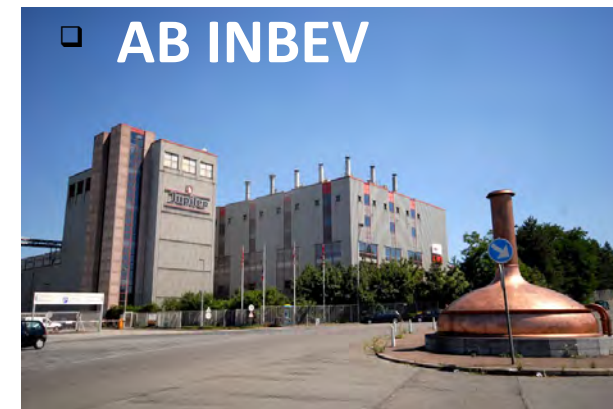
□ AB INBEV