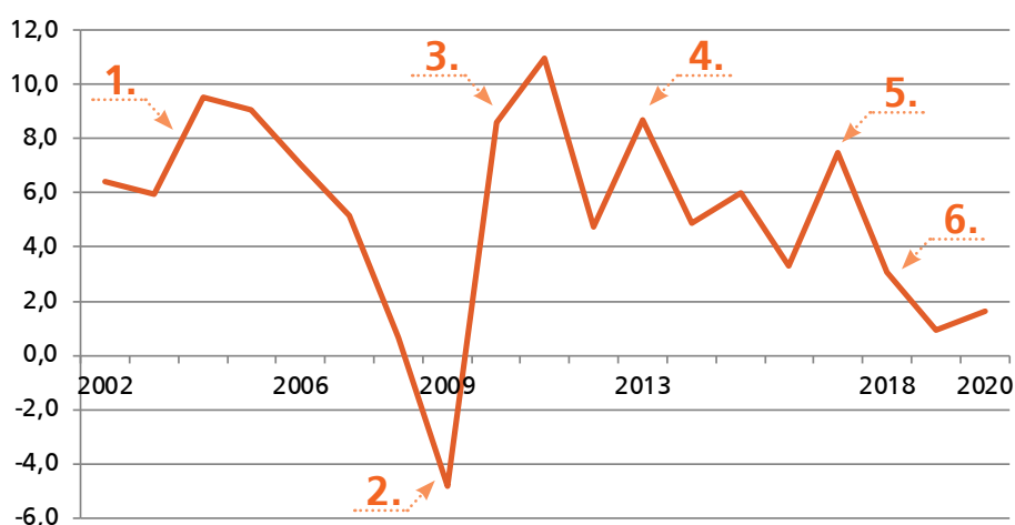
Abbildung 3: Entwicklung des Bruttoinlandsprodukts (inflationsbereinigt) in Prozent (2002-2020)

1. Auf die Wirtschaftskrise von 2001 folgte mit dem von Kemal Derviş entworfenen und von Ali Babacan fortgeführten Programm eine schnelle wirtschaftliche Erholung.